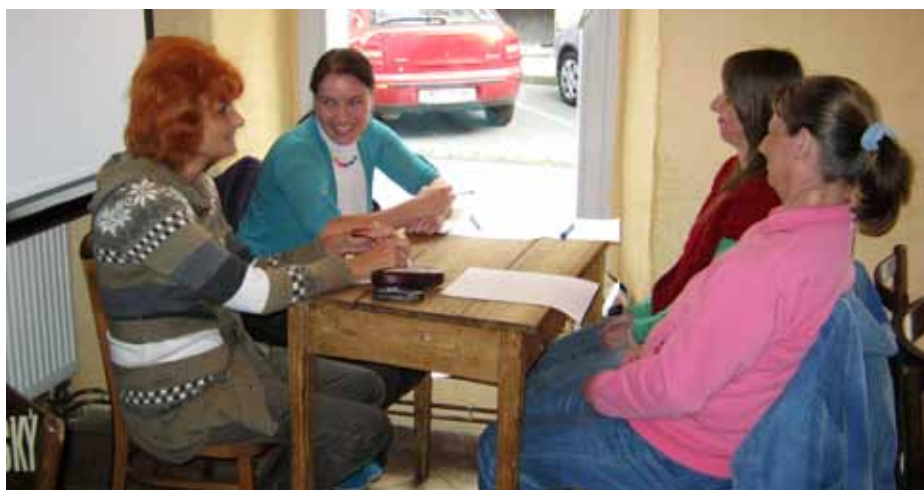
Oslava Mezinárodního dne seniorů - DivSeFest 2013 - v Českých Budějovicích

Více fotografií naleznete na www.ledax.cz v sekci fotogalerie.