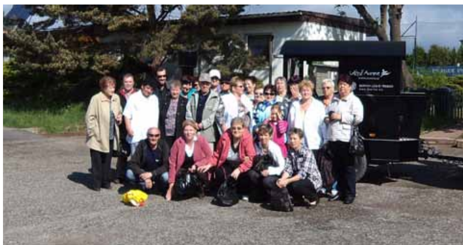
Výlet DPS Týn nad Vltavou do Třeboně