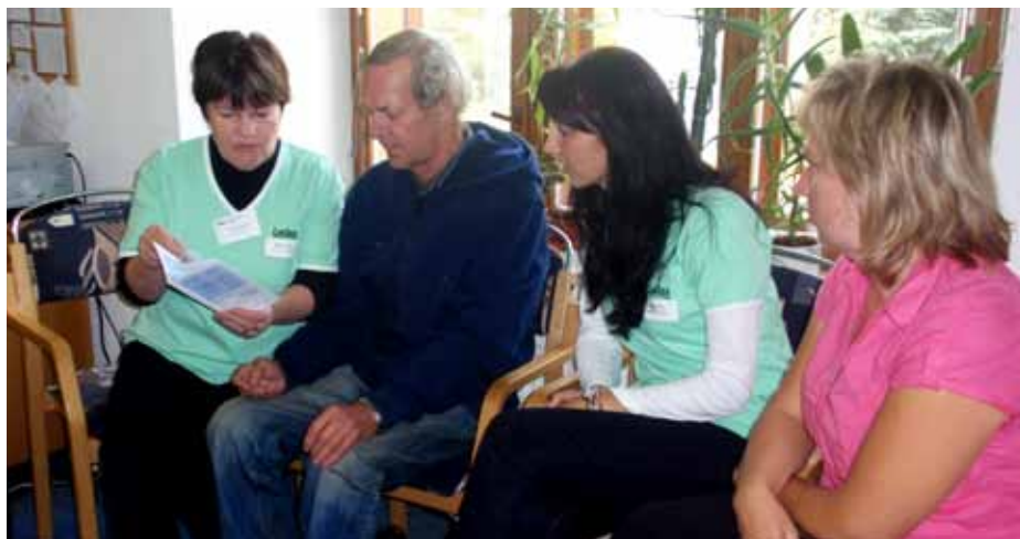
Den otevřených dveří ve středisku Pečovatelské služby Ledax o.p.s. v Jindřichově Hradci